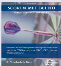
'Scoren met beleid' digitaal lesprogramma tweede fase havo/vwo

Onder meer de volgende uitgaven van de Nederlandsche Bank zijn verkrijgbaar: