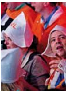
24 / Olympische Spelen: Vancouver onder een Hollands sausje